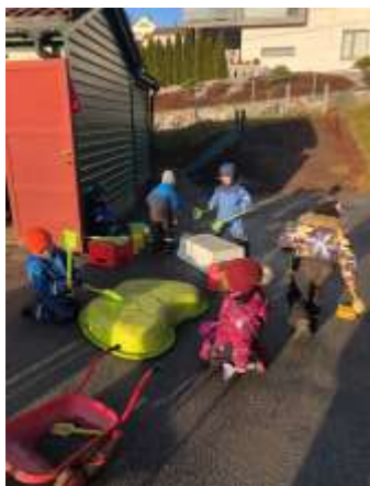
Her har vi et flott orkester

Barnehagens digitale praksis skal bidra til barnas lek, kreativitet og læring. Ved bruk av digitale verktøy i det pedagogiske arbeidet skal dette støtte opp om barns læreprosesser og bidra til å oppfylle rammeplanens føringer for et rikt og allsidig læringsmiljø for alle barn. Ved bruk av digitale verktøy skal personalet være aktive sammen med barna.